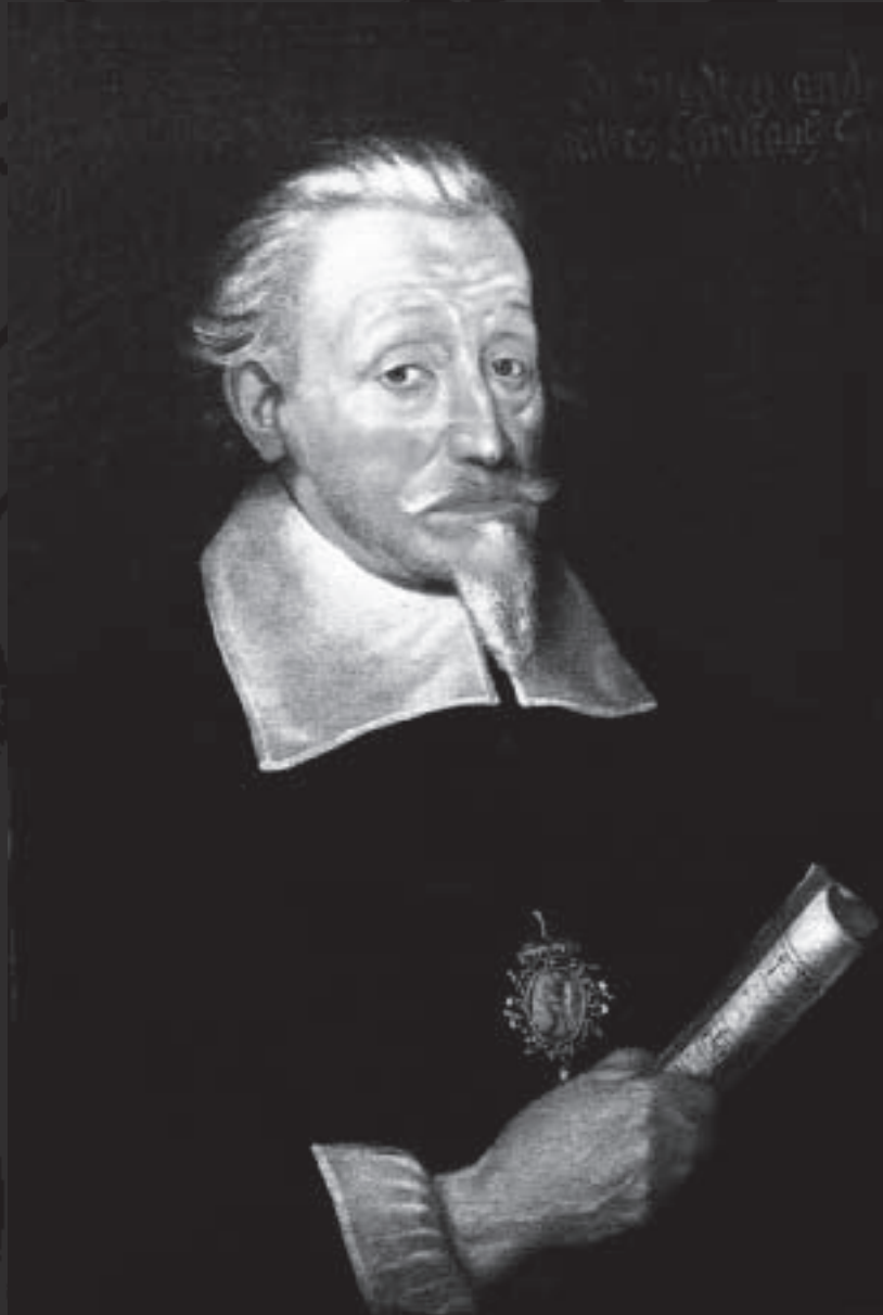
HEINRICH SCHÜTZ Christoph Spetner, Öl auf Leinwand, um 1650