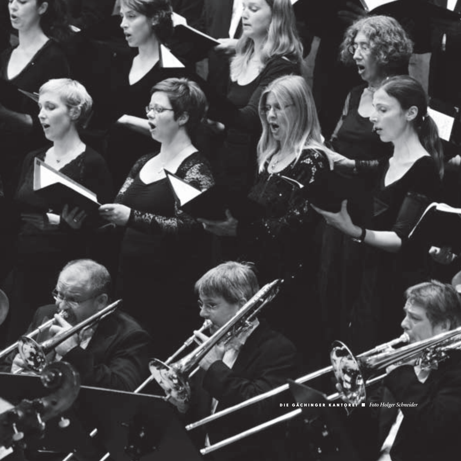
DIE GÄCHINGER KANTOREI