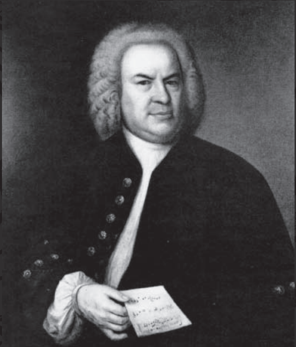
JOHANN SEBASTIAN BACH Elias Gottlob Haußmann, Öl auf Leinwand, 1746