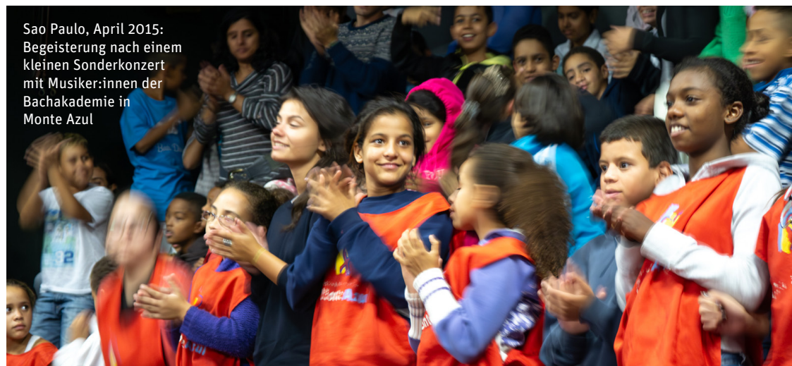
Sao Paulo, April 2015: Begeisterung nach einem kleinen Sonderkonzert mit Musiker:innen der Bachakademie in Monte Azul

IBAN: DE16 6005 0101 0002 9360 55 (BW-Bank), Kennwort: »Projekt Monte Azul«